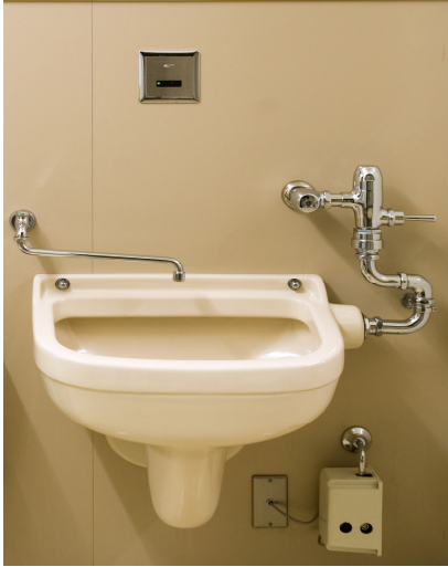
← 写真1 センサー式活栓

11. 吸引物を廃棄する汚物槽は、センサーまたは手を触れなくとも使用できる活栓のものが望ましい。(写真1)